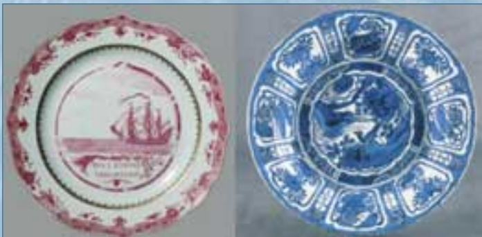
Vaisselle en porcelaine de la compagnie des Indes.

Une étude de la maquette de la Dauphine permettra en partant de celle-ci, d'évoquer la condition des marins et les difficultés rencontrées à bord.