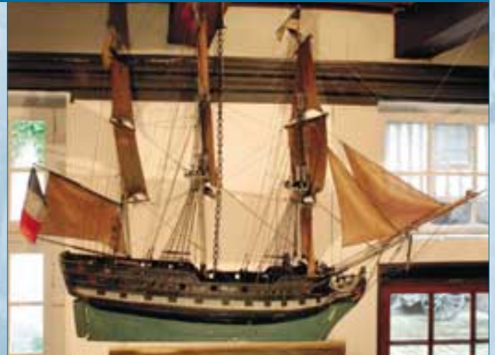
Maquette de navire : Ex voto provenant de l'église St Rémy, début XIX e siècle.