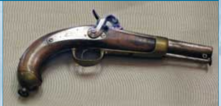
Pistolet d'abordage, France, modèle 1849.

Après une phase d'exploration, vint le temps du commerce, et des compagnies commerciales, comme la Compagnie des Indes, se mirent en place.