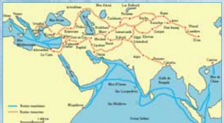
Carte des routes entre l'Asie et l'Europe (© Droit réservé).

En 1746, un navire de course, La Serionne, venant de Dieppe, portant 12 canons, 8 pierriers, 12 fusils et 8 pistolets s'empare de l'Albany, un brick anglais. D'autres bâtiments comme La Rusée et La Dauphine amènent leurs prises dans le port. Ce dernier continuait à être difficile d'accès et les conflits le privaient de travaux importants. Les tempêtes menaçaient de détruire les jetées de bois et les maisons du Petit Veules, tandis que le galet s'amoncelait à l'entrée du chenal et formait des pouliers. Il faudra attendre le XIX e siècle pour qu'une politique portuaire ambitieuse soit menée.