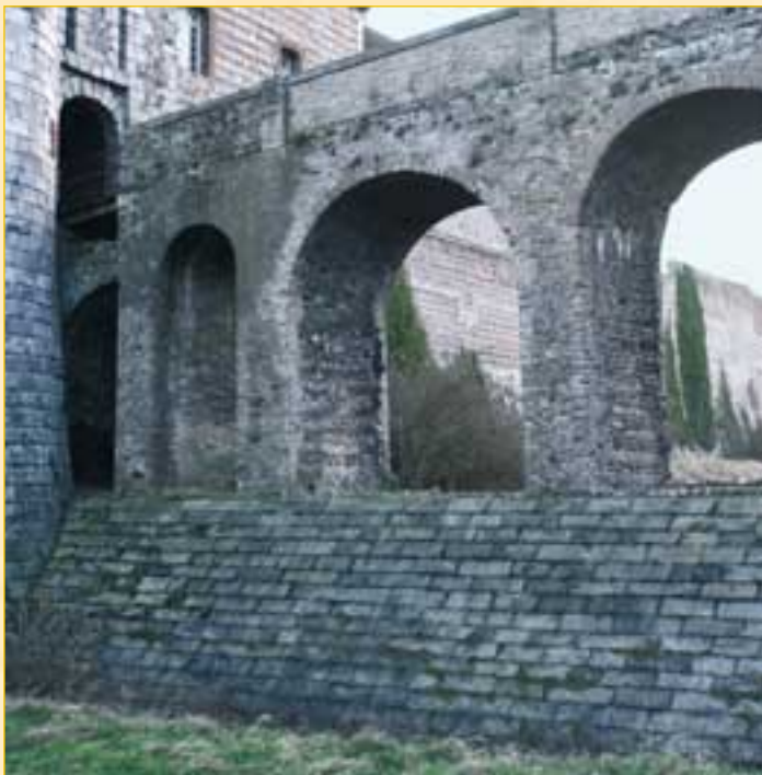
Pont avec soubassement.

La construction de la citadelle : elle eut lieu dans la seconde moitié du XVI e s. de forme trapézoïdale, c'était un ouvrage fortifié qui s'étendait à l'Ouest du château, à l'endroit où la falaise surplombe celui-ci. Flanquée de deux bastions, elle s'avancait d'environ 180 mètres devant la porte des champs et mesurait environ 300 mètres de large.