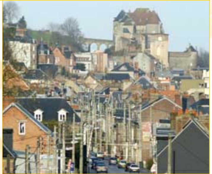
Vue générale du château avec la vallée de l'Arques. Vue prise de la rue Chanzy.

Il sera intéressant aussi de relever des éléments d'architecture plus tardifs tels que le mur bouclier tout en grès jouxtant la Porte des Champs et portant un chemin de ronde sur machicolis. Les dispositions des poternes par rapport aux accès et leur évolution. La disposition des tours rondes et des tours carrées. La barbacane du XVI e siècle et son rôle de défense avancée.