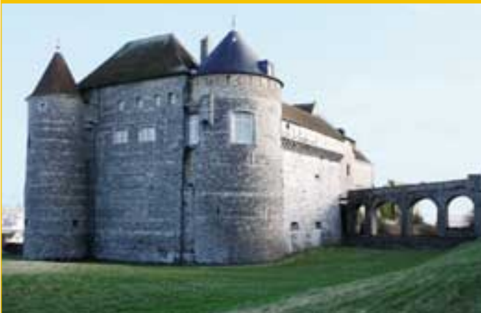
Grosse tour XIV e siècle, courtine et tour nord XV e siècle.

Le donjon urbain : son édification est donc contemporaine des murs d'enceinte de la ville. Il marquait la limite nord ouest de celle-ci avec une courtine courant sur toute la façade ouest vers le sud, d'une part, et d'autre part un autre mur, perpendiculaire qui fait face à la mer. La tour ferme cet angle. Ce donjon mesure 11 mètres de diamètre et 18 mètres de haut, il est surmonté de créneaux dont la trace est encore visible. Le toit en poivrière ayant été rajouté ultérieurement. Il se compose d'une alternance de couches de silex taillé et de strates de grès. À cette époque, les défenseurs des sites castraux préfèrent l'arbalète dont le tir est plus puissant que les arcs et les flèches. C'est pourquoi cette tour est dotée de meurtrières en forme d'arbalétrières. Certaines se doteront plus tard d'un trou pour l'utilisation de la couleuvrine. Le mur d'enceinte en plein ouest est par ailleurs percé d'une poterne permettant l'accès à l'intérieur de la ville.