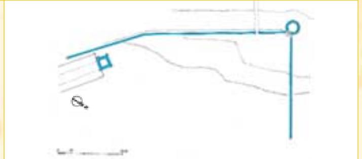
Plan du castral de la grosse tour. Fin du XIV e siècle.

Avant le château, le castrum : au XII e siècle, Dieppe était une cité anglaise lorsqu'elle fut attaquée vers 1193 par le Roi de France, Philippe Auguste. Elle fut pillée et saccagée sans offrir la moindre résistance, et pour cause, elle n'était pas fortifiée. C'est seulement après une attaque dirigée contre la ville au tout début de la Guerre de Cent Ans (en 1339) que celle-ci voit se dresser des murs d'enceinte, dans une politique globale de renforcement des défenses en Normandie entre 1340 et 1360. En 1362, elle est qualifiée de « ville fermée ». Un impôt est levé auprès des bourgeois pour la garde des fortifications. Le site de l'actuel château se dote alors d'un donjon urbain.