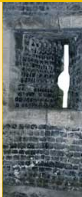
Meurtrière, tour ouest.

Le château royal : il est construit un siècle plus tard sous Charles VII, à la fin de la Guerre de Cent Ans. Prenant appui sur le donjon préexistant, il s'adosse aux deux murs d'enceinte fermant la ville à l'ouest. La porte à herse devient « la Porte des Champs », par opposition au nouvel accès que l'extension du bâtiment impose en venant de la ville, au-dessus de la Porte de la Barre. Cette porte à pont-levis à double accès – piéton et cavalier - devait être flanquée de deux tours. La tour Est (côté ville) a bien été construite malgré les difficultés dues au dénivelé du terrain. De l'autre côté, on ne sait si la seconde fut ébauchée. Elle aurait eu un rôle non négligeable dans la défense du site. Elle fut cependant remplacée par un ouvrage rectangulaire au XVI e siècle. Remarquons aussi que la courtine qui fait face à la mer s'avance d'environ 6 mètres par rapport aux fortifications de la ville et vient se raccorder à la tangente côté nord-ouest de l'ancien donjon, enfermant une partie de celui-ci à l'intérieur du château (une arbalétrière est de nos jours visible à l'intérieur de la salle dite « d'archéologie »). La muraille initiale qui dégagait entièrement cette tour, à l'époque vieille d'un siècle, fut démolie. Ce qui, au niveau défensif, semble illogique s'explique sans doute par une volonté de gain de place vers la façade maritime. La forte pente du terrain compliquant le travail des bâtisseurs en descendant vers la ville.