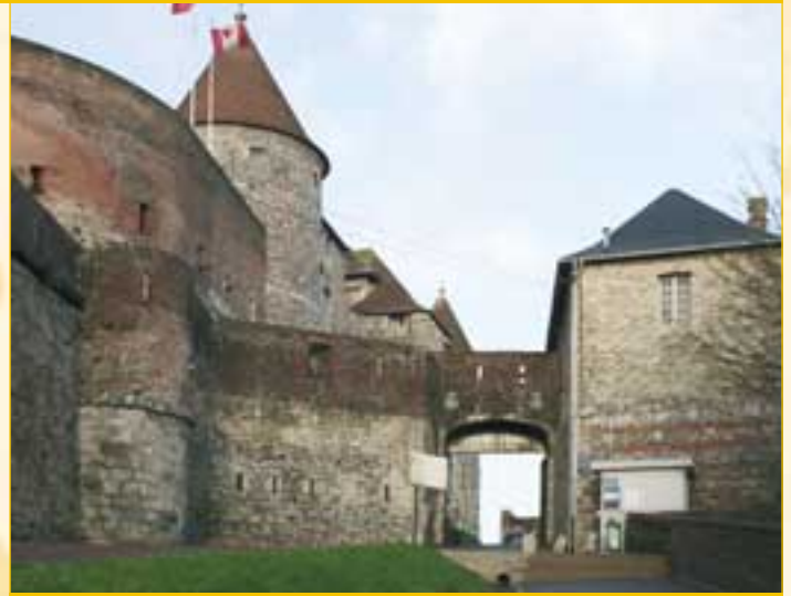
Barbancane devant l'entrée du château.