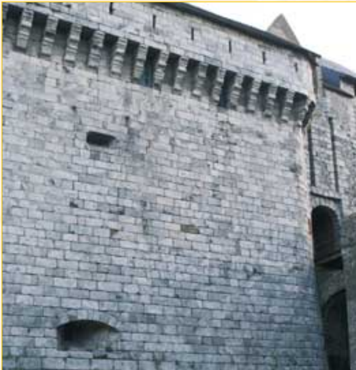
Mur bouclier à l'ouest.

La visite du château par l'extérieur peut s'inscrire dans une randonnée, ou dans une suite de visites avec un circuit dans Dieppe. On pourra privilégier l'aspect lecture de la ville et de ses défenses – port-front de mer-château - ou bien l'aspect lecture du paysage et situation stratégique.