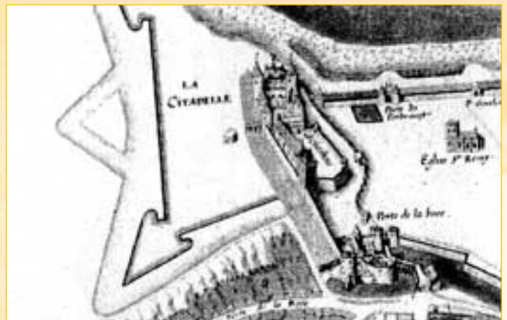
Plan de Dieppe dans l'Atlas Louis XIII. (© Christian Corvisier)

Le grand architecte Philibert de l'Orme, nommé ingénieur militaire au service du Roi, avait passé marché avec deux maîtres maçons chargés de travailler aux fortifications de Dieppe, en particulier, le tronçon entre la barbancane et la tour Saint Rémy à l'Ouest. Un premier pont-levis est érigé entre la citadelle et le château.