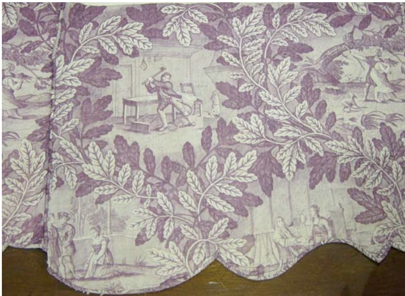
Toile imprimée vers 1825, manufacture Bapaume et Cocatrix à Rouen, Musée de l'Impression sur Etoffe de Mulhouse, Inv. 954.36.2