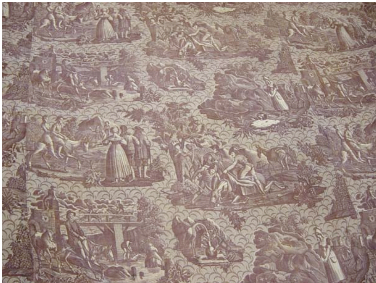
Toile imprimée, premier quart du XIXème siècle, Musée industriel de la Corderie Vallois, Inv. 98.4.400