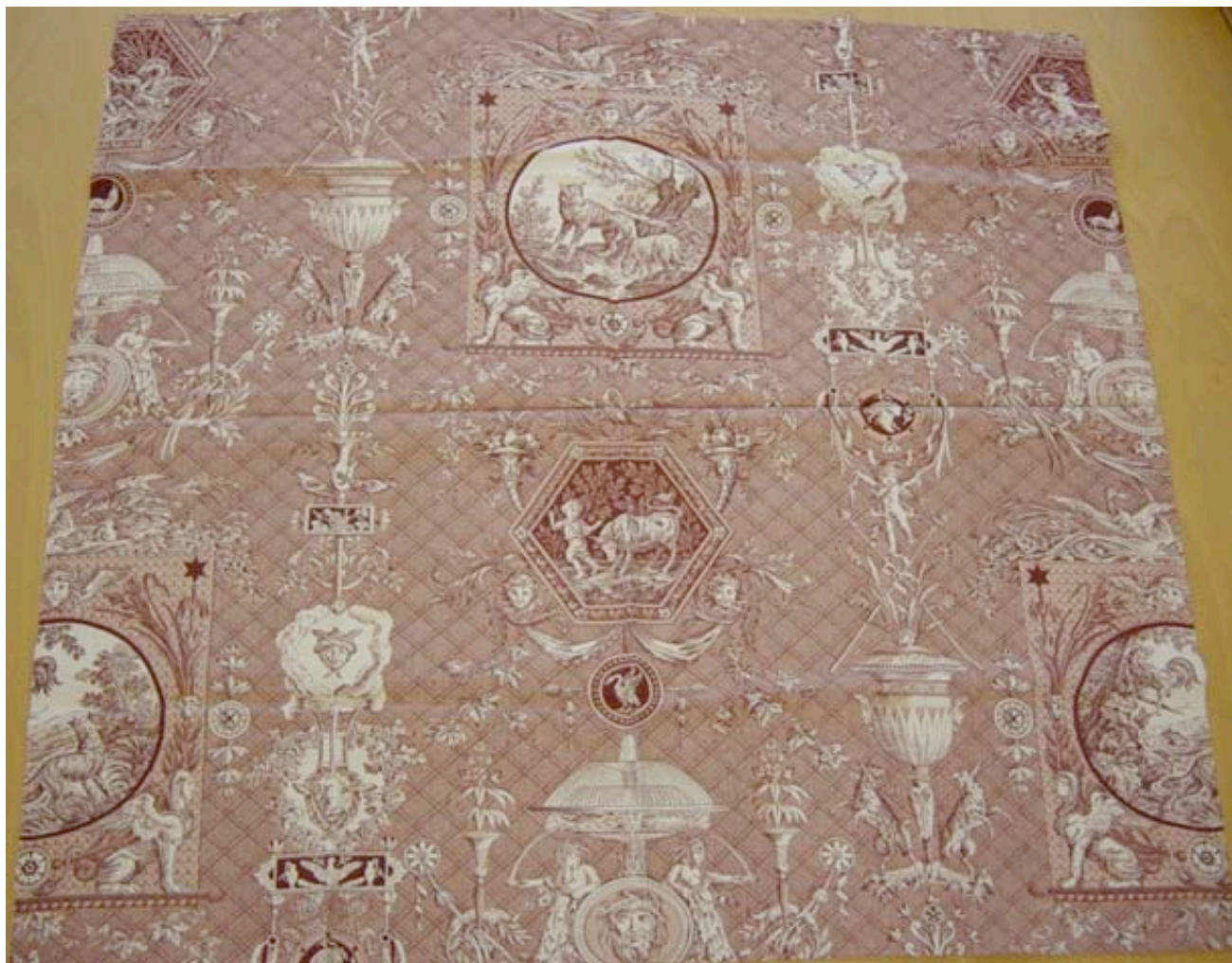
Toile imprimée dans une manufacture normande