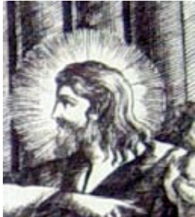
Une scène biblique .....

- Chacune des quatre images est extraite d'une toile portant sur un thème spécifique. A vous de retrouver le nom de chacune des quatre toiles et de l'indiquer sous le détail.