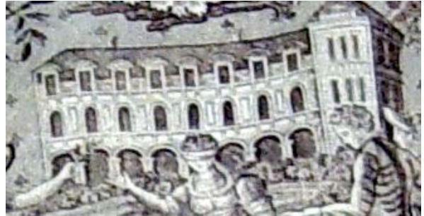
Une scène de la vie quotidienne .....