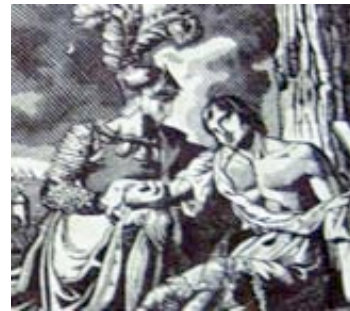
Une scène historique .....

Au XIXème siècle, les sujets représentés sur les toiles imprimées à personnage sont en général issus de thèmes à la mode popularisés par les romans, opéra et pièces de théâtre de l'époque. C'est pourquoi on retrouve surtout des sujets bibliques, mythologiques, historiques, littéraires ou des représentations de la vie quotidienne.