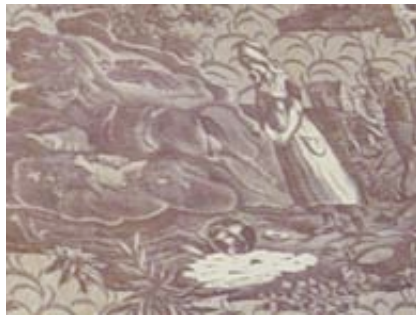
Une scène littéraire .....